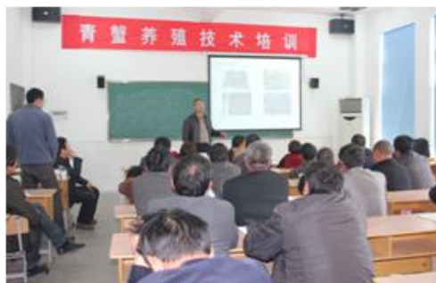
图为邀请专家为养殖户进行青蟹养殖技术培训

与宁波海洋研究院合作编写《虾蟹养殖技术》校本课程，教会渔民掌握虾、蟹等甲壳动物生态习性、繁殖习性等基础知识和掌握人工育苗技术。同时学校和海洋研究院一起合作申报科技项目，科技引领来提高渔业的经济效益。