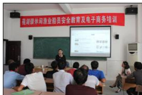
图为组织休闲船员进行安全教育及电子商务培训