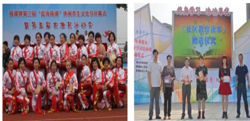
图为“蓝海”莼湖艺术节及首届读书节

累起丰富的海洋文化知识，养成勇于进取的精神，不断充实自身的文化内蕴。幼儿园、中小学通过参观中心小学的全国海洋文化实践基地，了解海洋经济、认识海洋资源，懂得海洋保护。在广大社区、农村积极普及海洋基础知识教育，提高全民的海洋意识，让居民个体在实践中自我练习、学习和成长，增强蓝海莼湖海洋意识教育目标，主动提高学习海洋文化知识的积极性，提高自身的海洋认识水平，形成全社会关注海洋、保护海洋、开发海洋的良好文化氛围和自觉的海洋意识。