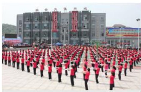
图为“蓝海莒湖”文化节开幕式

作为一座已有 2200 多年历史的渔业大镇，莒湖不断提升海洋文化品质，建设捕、养、销相配套的海洋产业文化，策划桐照开渔节、休闲渔船等文化旅游，依托“中国长寿村”品牌，结合一年一度的三月三牡丹花会、“蓝海莒湖”休闲养生文化节等品牌活动，多层次、多形式地形成了特色海洋文化。