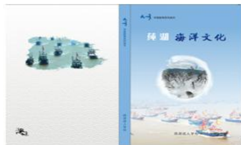
图为校本教材系列之一“海洋文化”封面

编写了“海洋环境教育”的校本教材；开展一系列的蓝色环境教育活动，如：布置了海洋科普知识长廊，制定海洋科普知识活动计划，开展“海洋牧场”讲座，进行海洋