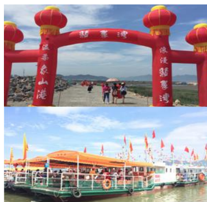
图为翡翠湾开游节

与旅游公司合作开发海湾风光体验游，体验出海捕鱼，享受海风和美味野生海鲜。翡翠湾观光码头拥有 38 条休闲渔业观光船、现代化管理团队、个性化服务理念、完善的安全设施设备。景区交通便捷，距离奉化城区 25