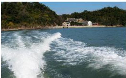
图为“小普陀”横山岛

公里、宁波市区 40 公里，是休闲海滨度假、赶海娱乐和品尝海鲜美食的绝佳旅游胜地。