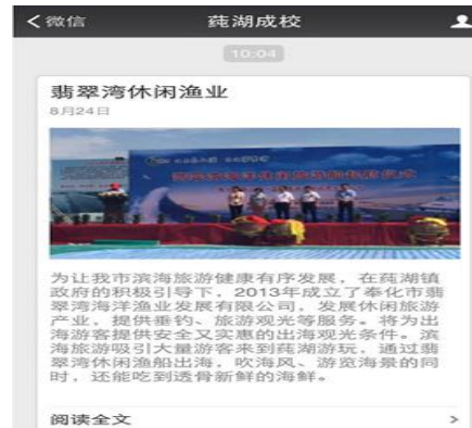
图为学校微门户“翡翠湾”首页。

随着休闲时代的到来，休闲体验已成为旅游者消费需求的一大特征，而海洋旅游所具有的良好环境、丰富内容又能为游客休闲提供特殊的经历与体验。学校积极做好镇政府的参谋，将由传统的阳光、沙滩、海水等单一产品逐步扩展出水上运动项目、海洋观光、休闲捕捞、垂钓等项目，形成滨海、海面、空中、海底立体式的海洋度假旅游产品系列。